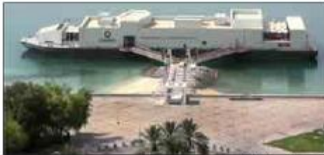
مركز مشيرب لإثراء المجتمع

الإدارة المالية وخدمات الشركة "مشيرب العقارية"، والذي كان أحد المتحدثين في الندوة: "تعتبر إدارة المخاطر ضمن المؤسسات مسألة متشعبة لكنها أيضاً موضوع بالغ الأهمية لدى كافة الشركات العاملة في الأسواق المتنامية كما هو الحال في السوق القطرية. ونحن في مشيرب العقارية نرى أن التوجه الأسبب والأفضل في هذا النطاق هو التركيز على تقسيم المخاطر ضمن الشركة وأقسامها والمشاريع التي تنفذها، بهدف معالجة مخاطر قد تتهدد القطاع المؤسسي على نحو مناسب