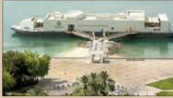
«مرکز مشيرب لإدارة المخاطر»

مسألة متشعبة لكنها أيضاً موضوع بالغ الأهمية لدى كافة الشركات العاملة في الأسواق المتنامية كما هو الحال في السوق القطرية ونحن في «مشيرب العقارية» نرى أن التوجه السليم والأفضل في هذا النطاق هو التركيز على تقييم المخاطر ضمن الشركة وأقسامها والمشاريع التي تتولاهما، بهدف معالجة أية مخاطر قد تهدد النشاط المؤسسي على نحو مناسب ونحن نأمل أيضاً أن تكون العروض التوضيحية التي قدمها فريق معهد إدارة المخاطر قد ساعدت في تسليط الضوء على الحاجة الماسة لاعتماد