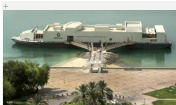
Msheireb Enrichment Centre OCT 2011

Annual event highlights importance of timely management in mitigating enterprise risks